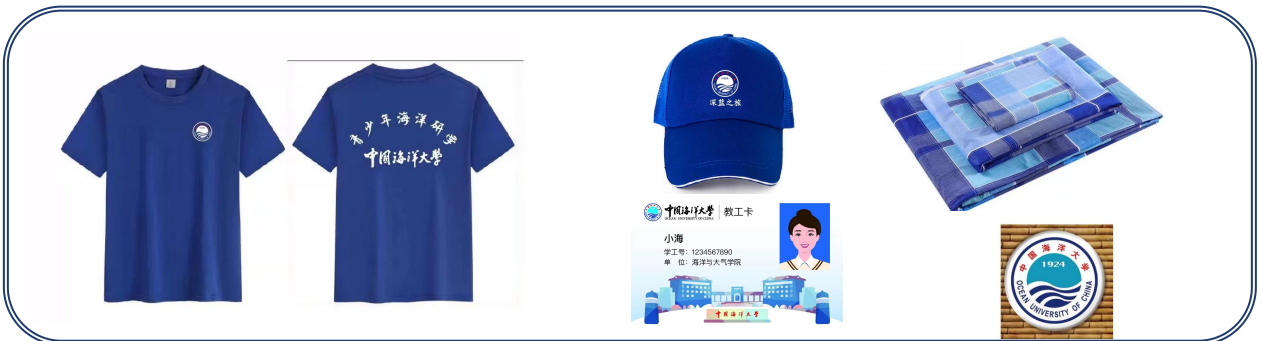
研学材料包与文化服饰